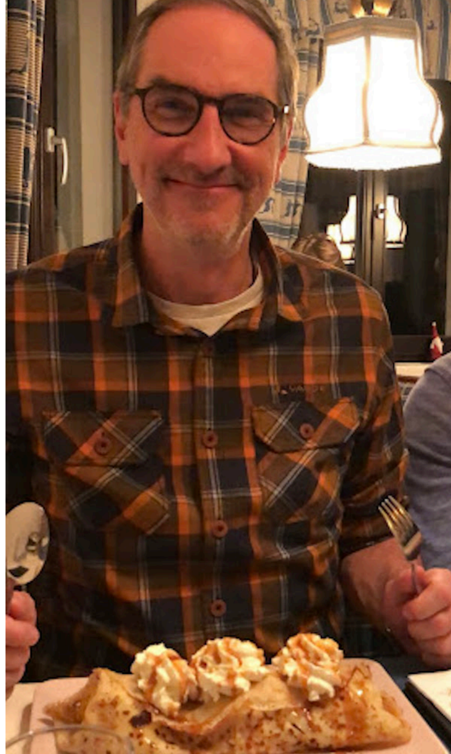
Wer kann dazu schon "Nein" sagen: Übergrößen beim Nachtisch

Selbstbestimmung und Freiheit bekommen wir nur, wenn wir uns aktiv entscheiden "Nein" zu sagen, Dinge sein zu lassen. Auf Verpflichtungen zu verzichten. Verantwortung abzugeben.