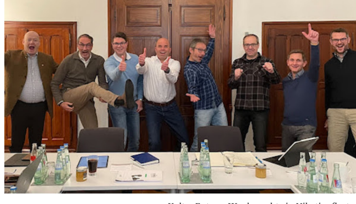
Kalter Entzug: Wer braucht ein Nikotinpflaster?

Nach dem Motto "Kein Unternehmer bleibt zurück" ist auch mein Herzensprojekt, der Unternehmer-Freiheitsclub, mit einer neuen Gruppe ins Jahr gestartet.