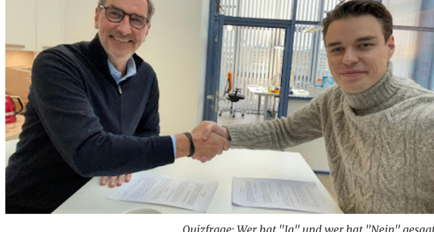
Quizfrage: Wer hat "Ja" und wer hat "Nein" gesagt?

Und ich habe bewusst "Nein" gesagt. Das hatte ich mir für 2022 vorgenommen. Das ganze letzte Jahr habe ich an dem Deal gearbeitet und zum Jahreswechsel ist es dann endlich passiert: Ich habe meine Online-Marketing Agentur, die Franchise Rockstars, verkauft.