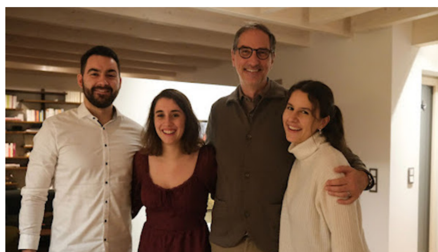
Stolzer kann der Papa nicht sein: Nein Sagen unmöglich

Silvester war ich mit den Kindern in Kärnten. Ganz ruhig und entspannt sind wir in das neue Jahr gestartet, so wie quasi jeder mit dem ich gesprochen habe. Du auch?